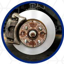
Freno Delantero o de Disco

Una de las causas que producen daños en los bujes de suspensión delanteros se debe principalmente a los frenos de tambor, (situados en los neumáticos traseros de tu automóvil). Esto se debe principalmente a la falta de mantenimiento del sistema de frenos traseros, el vehículo esta diseñado para frenar equilibradamente, pero con la falta de mantenimiento suelen frenar más con los neumáticos delanteros hasta un 70% y con los traseros solo un 30%.