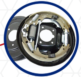
Freno Trasero o de Tambor