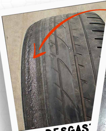
DESGASTE DE NEUMÁTICO

Esto se presenta cuando ya existe un serio desgaste en la rótula, se refleja una mayor inestabilidad en carretera y desgaste del neumático. (Es momento de reemplazar la rótula).