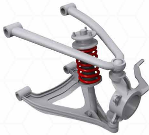
Suspensión doble horquilla

La rótula automotriz tiene como función brindar movilidad en el eje delantero y trasero del automóvil.